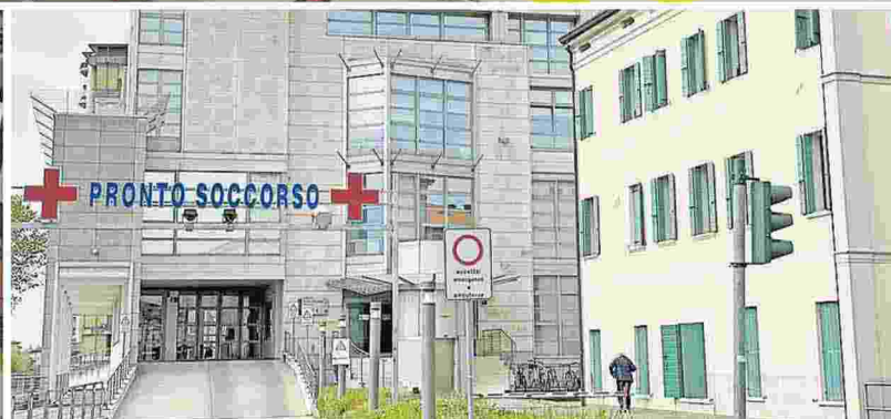
In senso orario: primo soccorso, il Pronto Soccorso di Camposampiero, attività amministrativa e anestesisti: sono alcuni dei servizi in appalto